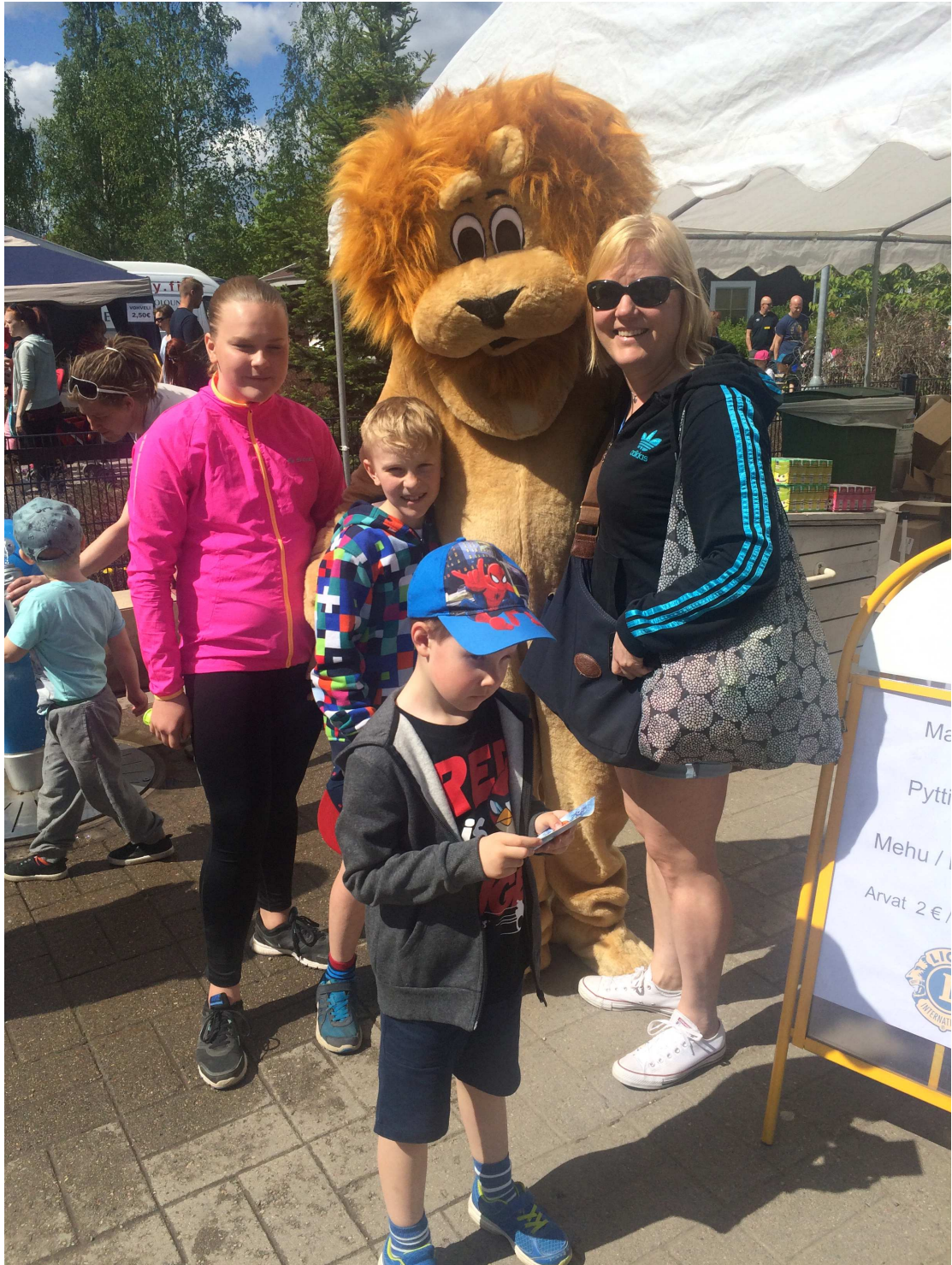
Aluella kiertävä Lions-leijona oli lasten suursuosikki, joka veti kainaloonsa niin lapsia kuin vähän vanhempiakin.